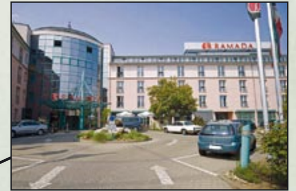
RAMADA Hotel Magdeburg Hansapark 2, D-39116 Magdeburg