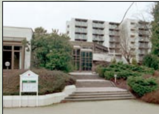
RAMADA Hotel Bad Soden Königsteiner Str. 88, D-65812 Bad Soden am Taunus