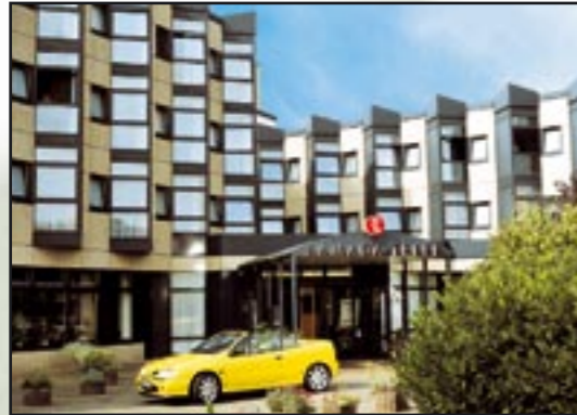
RAMADA Hotel Brühl-Köln Römerstr. 1, D-50321 Brühl bei Köln