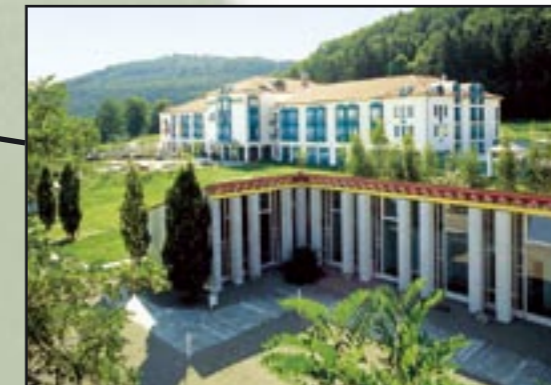
RAMADA Hotel Limes-Thermen Aalen Osterbacher Platz 1, D-73431 Aalen