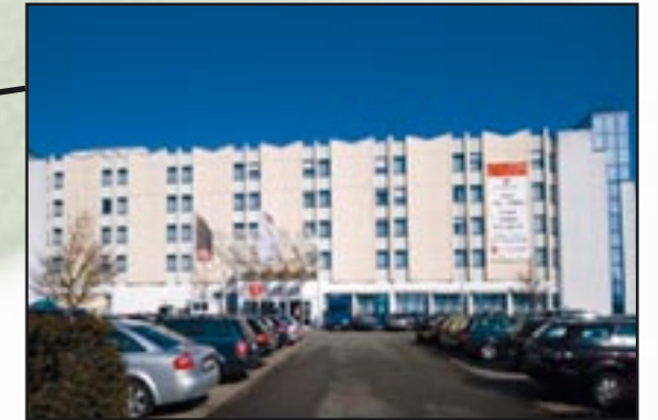
RAMADA Hotel Leipzig-Halle Hansaplatz 1, D-06188 Halle/Peißen