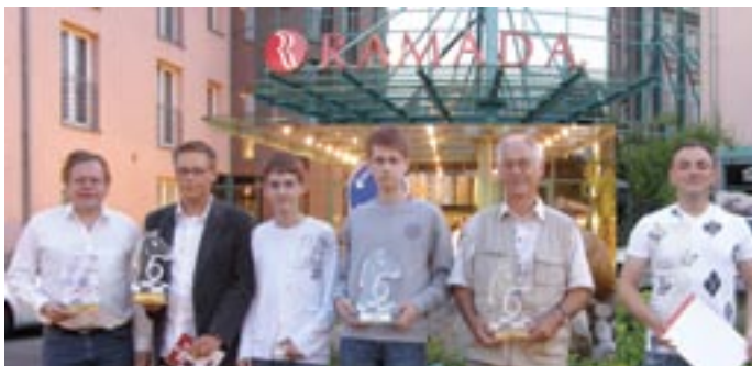
Die deutschen Meister 2008