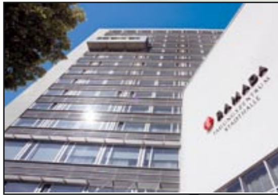
RAMADA Hotel Kassel City Centre Baumbachstraße 2, D-34119 Kassel