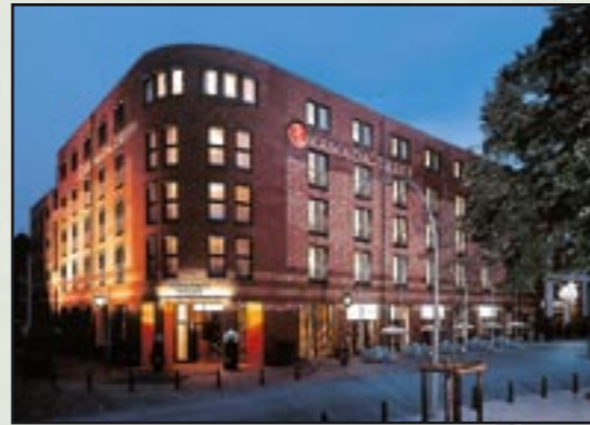
RAMADA Hotel Hamburg-Bergedorf Holzhude 2, D-21029 Hamburg